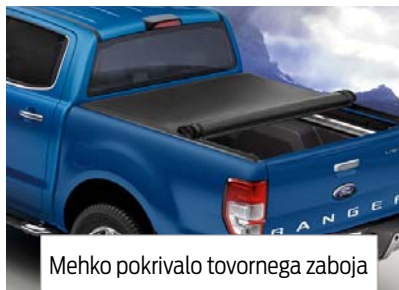
Mehko pokrivalo tovornega zaboja