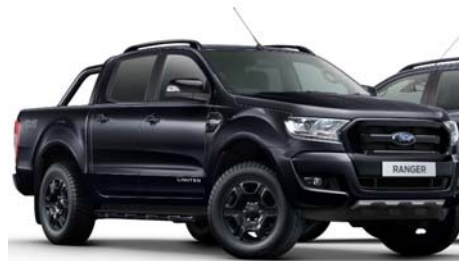
Stilski paket Limited Black