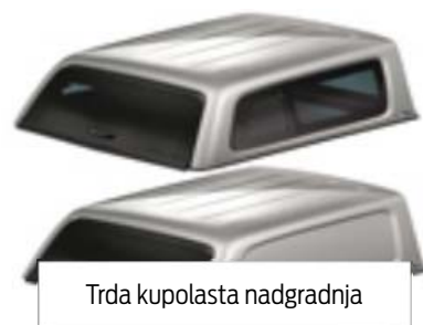
Trda kupolasta nadgradnja