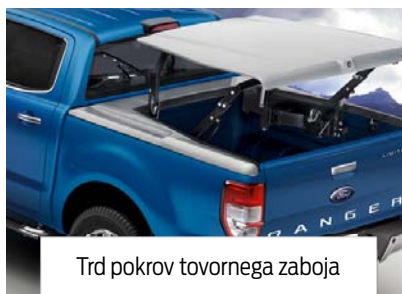
Trd pokrov tovornega zaboja