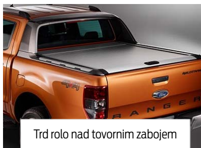
Trd rolo nad tovornim zabojem