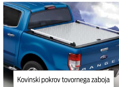
Kovinski pokrov tovornega zaboja