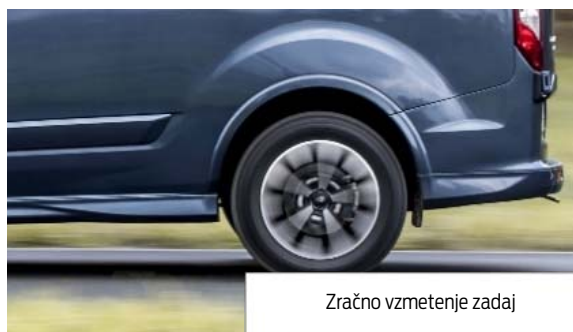
Zračno vzmetenje zadaj