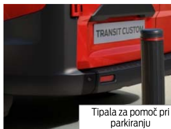
Tipala za pomoč pri parkiranju