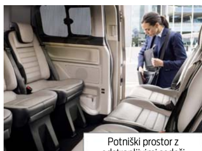
Potniški prostor z odstranljivimi sedeži