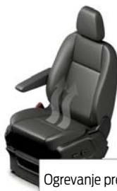
Ogrevanje prednjih sedežev